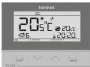
TERMET ST-292 V2