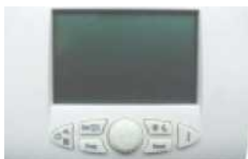
TERMET ST-292 V2